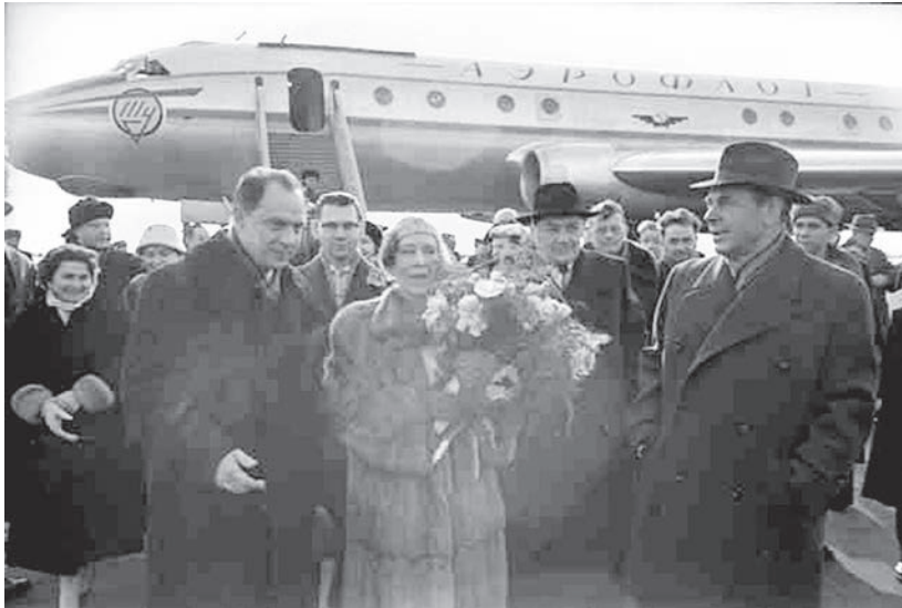
La reine Élisabeth suscita bien de l'inquiétude et du mécontentement de la part du gouvernement belge avec ses voyages dans le "Bloc de l'Est" au cours des années '50. Elle arrive ici à Moscou en avril 1958 à bord d'un appareil de la firme soviétique "Aeroflot".