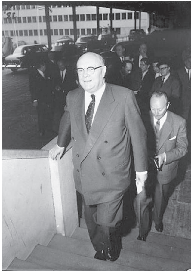
D'intenses débats se déroulèrent au sein de l'OTAN quant à l'assouplissement des relations avec le "Bloc de l'Est" durant la seconde moitié des années '50. Ici, le ministre des Affaires étrangères Paul-Henri Spaak lors d'une conférence de l'OTAN, à Paris, le 5 septembre 1956.