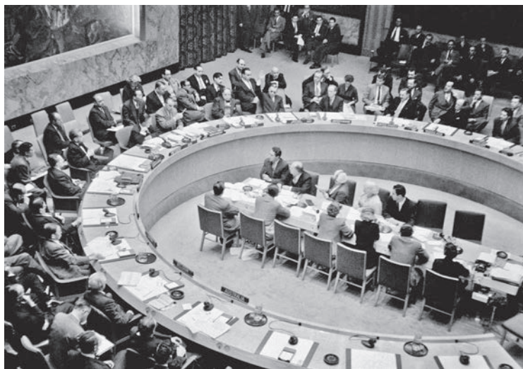
La réaction musclée des Soviétiques à l'insurrection hongroise suscita une commotion internationale de grande ampleur. Lors d'une réunion du Conseil de sécurité de l'ONU, à New-York (5 novembre 1956), la question hongroise fut abordée à l'ordre du jour.