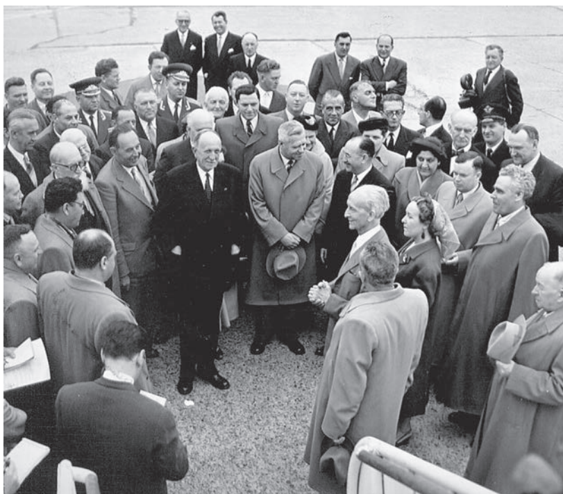
Le président de la Chambre, Camille Huysmans, salue une délégation parlementaire soviétique lors de son arrivée à l'aéroport de Zaventem, en mai 1956.