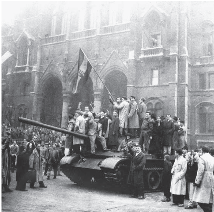
À Budapest, durant la révolte de l'automne 1956, des insurgés hongrois hissent leur drapeau sur un blindé soviétique endommagé.