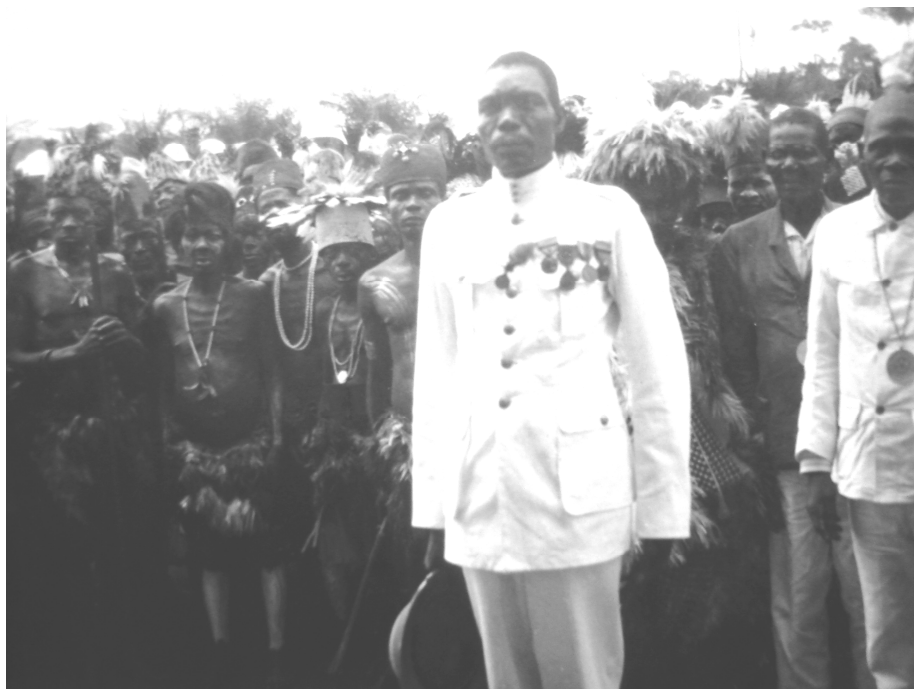
FOTO 4: "LE CHEF VIENT NOUS SALUER; C'EST UN BEAU NÈGRE BALUBA, HABILLÉ EN EUROPÉEN AVEC UN CASQUE BLANC; DOMMAGE" 37