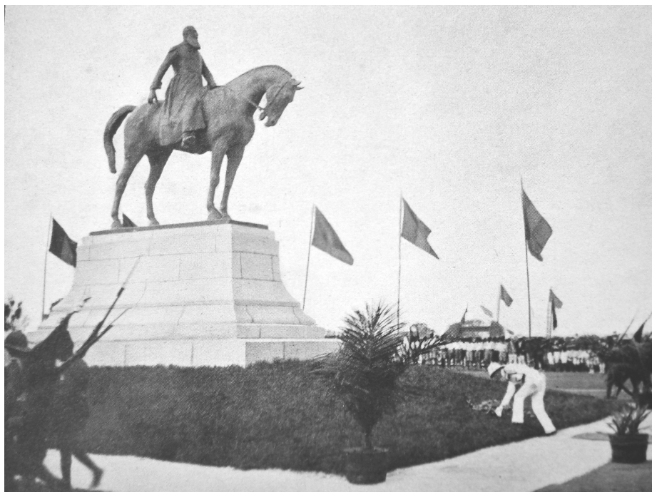
FOTO 1: "LE ROI DÉPOSANT UNE COURONNE AU PIED DE LA STATUE DE LÉOPOLD II QU'IL VIENT D'INAUGURER", LÉOPOLDVILLE 5

Op 21 juni 1928 liep de "Thysville" de haven van Boma binnen. Koning Albert was aangenaam verrast door het enthousiaste onthaal dat het vorstenpaar te beurt viel, ook en vooral vanwege de massaal aanwezige zwarten. Boma was het oudste Europese centrum in Congo en van 1886 tot 1926 de hoofdstad – eerst van de Vrijstaat en nadien van de kolonie. Na een bezoek aan de haveninstallaties en een excursie in het omliggende gewest, ging het per vliegtuig naar Thysville, 240 km landinwaarts, en vandaar, na een bezoek