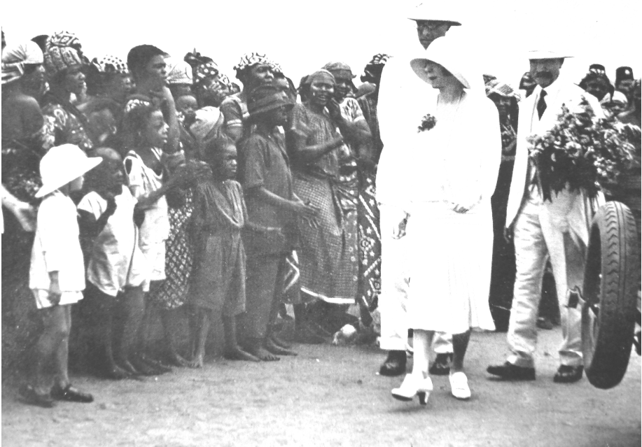
FOTO 6: BEZOEK AAN HET MILITAIRE KAMP VAN LÉOPOLDVILLE. FAMILIELEDEN VAN DE MILITAIRES 86

Het Congoreisdagboek van koning Albert werpt een duidelijk licht op de positie van de vorst in deze problematiek. Zijn reiservaring in de zomer van 1928 droeg er ongetwijfeld toe bij dat Albert zich meer dan voordien bewust was van de sociale gevolgen van de versnelde ontsluiting van de kolonie. Reeds voor de Congoreis, maar nog opvallender erna kan het Paleis tot het kamp van de sociale hervormers inzake koloniale politiek gerekend worden – zo er binnen het doorgaans hechte koloniale establishment al van "kampen" sprake kan zijn natuurlijk. Daarbij werd een grote rol toebedacht aan de ontwikkeling van de inheemse landbouw als een alternatief voor de voortschrijdende proletarisatie veroorzaakt door de Europese ondernemingen. In de rede die koning Albert bij zijn terugkeer in Brussel uitsprak, schoof hij de verbetering van de levensomstandigheden van de inheemse bevolking naar voor als een politieke prioriteit. De Britse ambassade in Brussel meldde aan