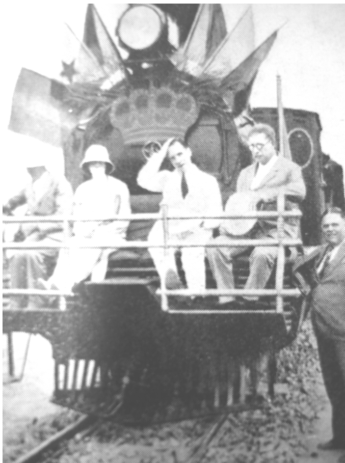
FOTO 3: DE GROTE AFSTANDEN TIJDENS DE VORSTELIJKE CONGOREIS WERDEN OVERBRUGD PER VLIEGTUIG, TREIN OF RIVIERBOOT. 30