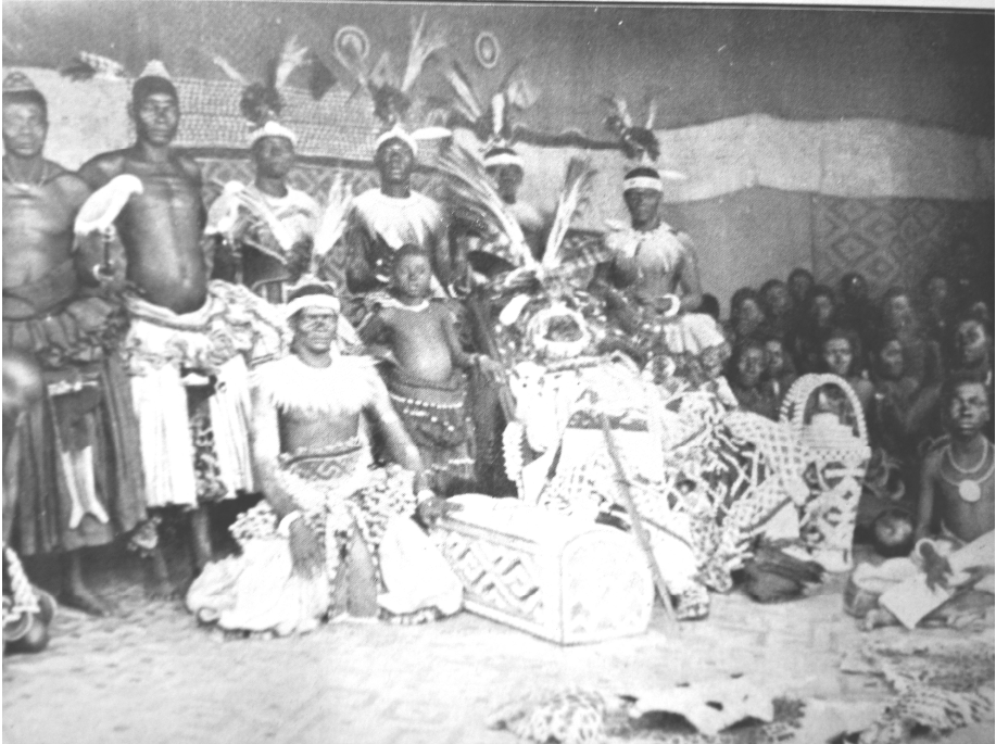
FOTO 2: "LE ROI LUKENGO AVEC SES MINISTRES ET SES TROIS CENTS FEMMES" 19

Op 11 juli deed het vorstenpaar zijn intrede in Elisabethville. De nog jonge, zich snel ontwikkelende stad maakte een gemengde indruk op de koning: