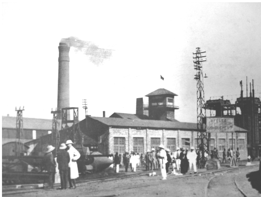
FOTO 5: "VISITE DES USINES DE PANDA (UNION MINIÈRE DU HAUT-KATANGA)" 55

schappijen, zoals Forminière en UMHK, die het actiefst wierven, zich op dit vlak benadeeld door het free-ridergedrag van de kleinere ondernemingen. Vermits de meeste arbeidscontracten een korte looptijd kenden (doorgaans van 6 maanden tot maximaal drie jaar), konden de kleinere ondernemingen vele arbeiders na afloop van hun eerste contract wegglokken met marginaal hogere lonen, zonder in de aanvankelijke rekruteringskosten te moeten delen. De wens om dit "gebrek aan fair-play" het hoofd te bieden en de noodzaak om de schaarse arbeidskracht sterker aan zich te binden – zonder evenwel af te stappen van de politiek van lage lonen – brachten de UMHK en Forminière ertoe hun aanpak van de arbeidsproblematiek grondig bij te stellen. Vanaf de tweede helft van de jaren 1920 maakten deze ondernemingen ernstig werk van een verbetering van de sociale voorzieningen met het doel een stabiel personeelsbestand op te bouwen. "Stabilisation de la main-d'œuvre" werd het nieuwe slagwoord.