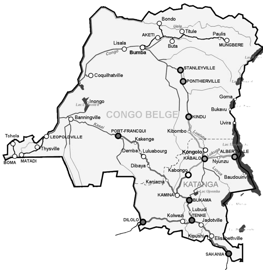
KAART 1: BELGISCH CONGO, SPOORWEGENNET AAN HET BEGIN VAN DE JAREN 1930 14