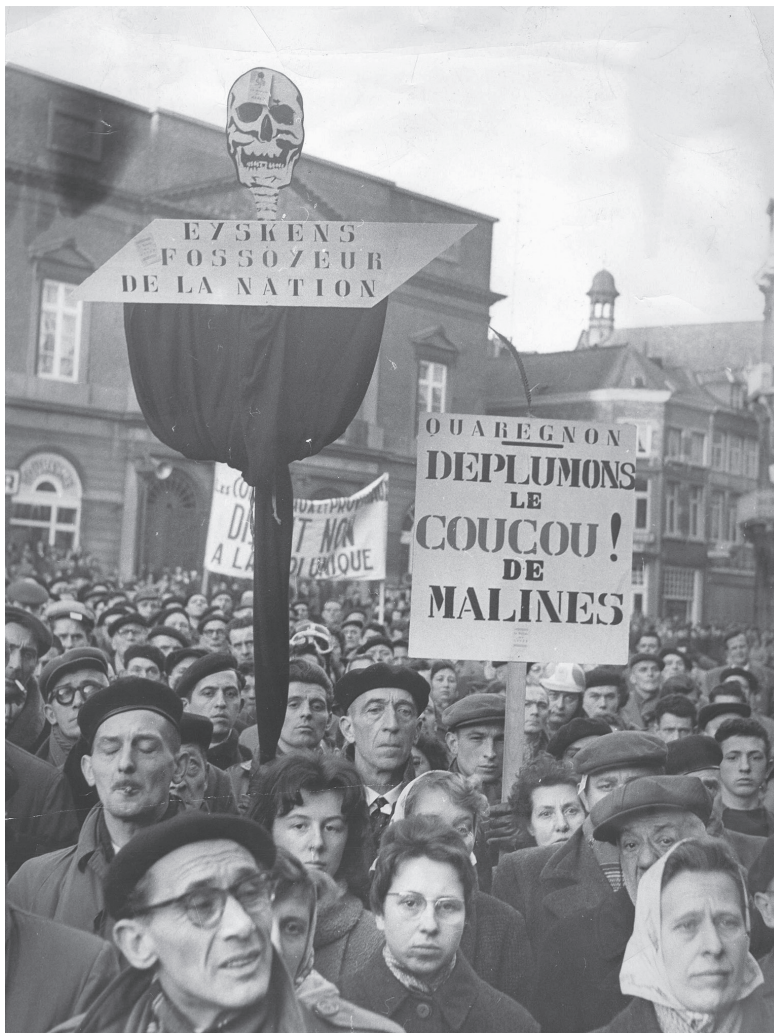
Betoging tegen de eenheidswet in Bergen. Op spandoeken staat "Déplumons le coucou de Malines" (laten we de Mechelse koekoek pluimen) en "Eyskens fossoyeur de la nation" (Eyskens doodgraver van de natie). In Wallonië was de staking ingrijpendere dan in Vlaanderen.