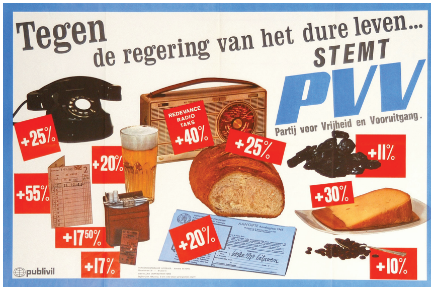
Verkiezingsaffiche van de PVV uit 1965 tegen taksen geheven op allerlei consumptiegoederen.