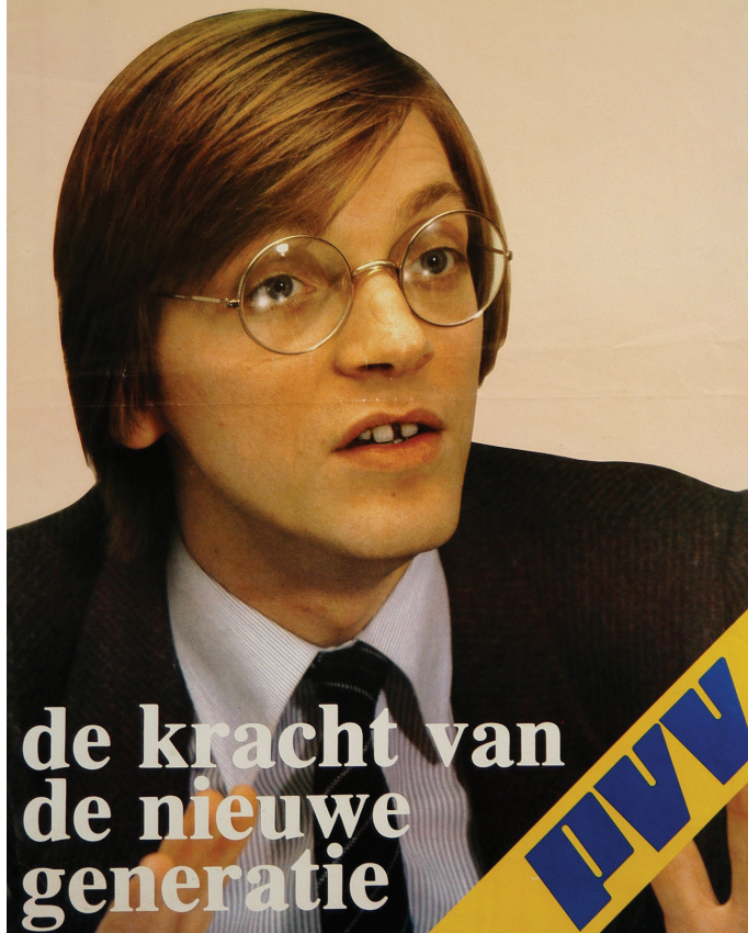
Guy Verhofstadt in de periode van zijn eerste burgermanifest, op een PVV-verkiezingsaffiche uit 1981.