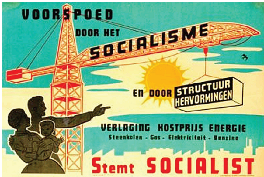
Socialistische verkiezingsaffiche uit 1961 met verwijzing naar de structuurher- vormingen.