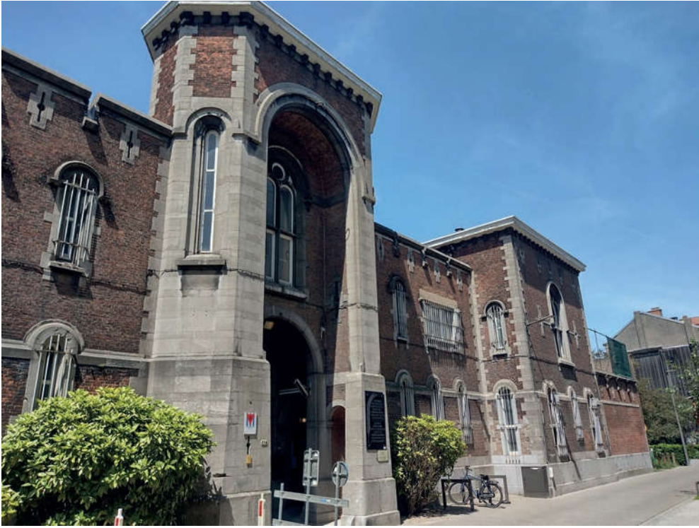
Gevangenis van Antwerpen in 2021. Rechts aan de toegangspoort hangt een zwart plakkaat met daarop "Hulde aan de gefusilleerden en politieke gevangenen uit de oorlogen 1914-1918 en 1940-1945 die in deze gevangenis opgesloten waren"