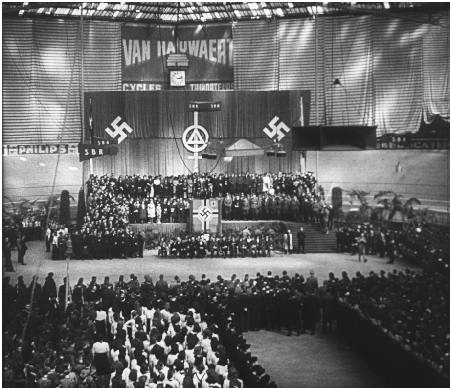
FOTO 3: BIJENKOMST VAN HET VNV IN HET BRUSSELS SPORTPALEIS, OP 18 APRIL 1943 29

actuele relevantie had. Eerst toonde men twee kortgerokte vrouwen, die in het Tabarincabaret in Parijs op houten paarden jongleerden en daarbij hun benen, billen en borsten toonden. Nadien werd hun act geparodieerd door twee mannen. Het was zonder enige twijfel het seksueel meest gewaagde onderwerp dat de AM-WA-journaals gedurende de hele bezetting bracht. Het was een onderwerp dat de Brusselse ATW-redactie probleemloos had kunnen wegsnijden, of naar een andere editie verschuiven, zodat men meer ruimte voor de VNV-mars had. Hetzelfde gold voor andere onderwerpen uit deze editie. Dat de redactie hier niet voor koos, is uiterst veelzeggend voor het belang dat men aan het VNV (en zijn tegenstanders) hechtte. Dit patroon zou zich nog een aantal keren herhalen.