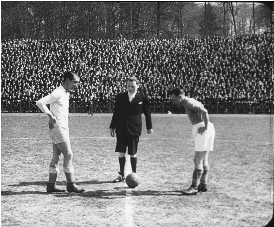
FOTO 1: HET FILMJOURNAAL OPENDE VAAK MET EEN LOKALE SPORTGEBEURTENIS. HIER DE VOETBALMATCH TUSSEN S.C. ANDERLECHT EN UNION ST. GILLEOISE (1-0), GESPEELD IN HET DUDENPARK IN BRUSSEL OP 4 APRIL 1943 21