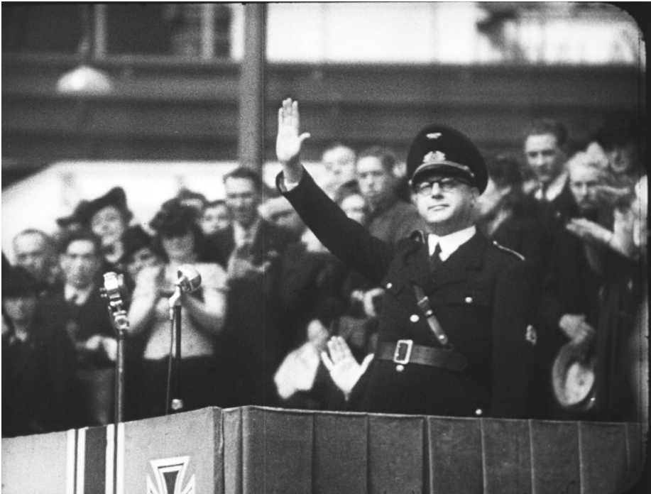
FOTO 4: HENDRIK ELIAS HOUDT EEN TOESPRAAK EN ZWAAIT VLAAMSE VRIJWILLIGERS VOOR DE WAFFEN-SS EN VOOR HET VLAAMS LEGIOEN UIT. DE JOURNAALCOMMENTATOR WIJST DE KIJKER OP HET BOLSJEWISTISCHE GEVAAR 30