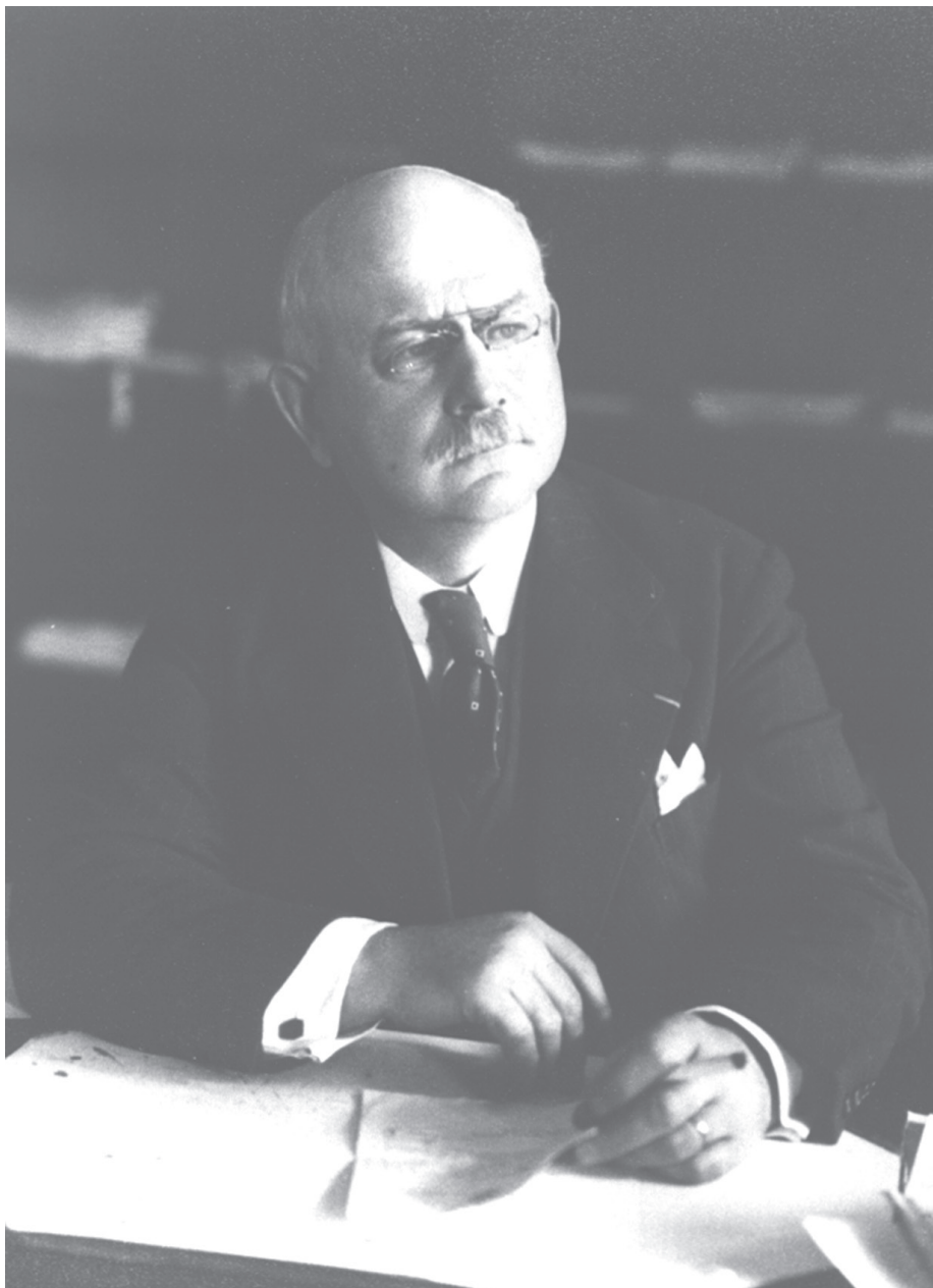
• Joseph Pholien, minister van Justitie in de regering Paul-Henri Spaak, mei 1938-februari 1939.