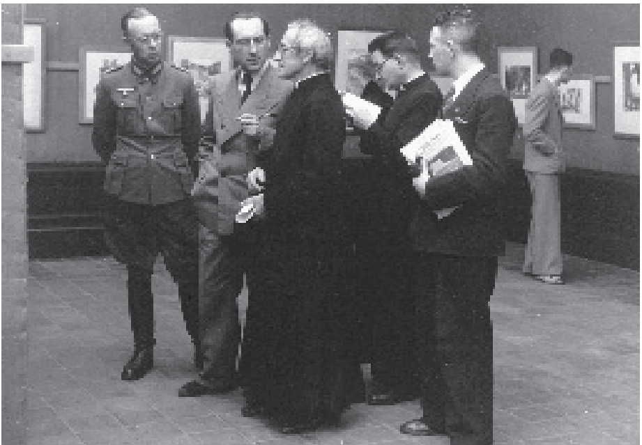
• Priester Cyriel Verschaeve, icoon van het Vlaams-nationalisme (Vlaanderen als “vooruitgeschoven bolwerk van ‘t Germaans bloed”), met achter hem priester Jean-Marie Gantois. Gantois was sinds de jaren dertig de racistisch denkende leider van het flamingantisme in Frans-Vlaanderen. Op de foto bezoeken ze samen in juli 1942 een tentoonstelling van Duitse grafische kunst in Gent.

De resultaten van dit historisch overzicht bevestigen zijn opmerkingen. Er zijn inderdaad dergelijke feiten in de geschiedenis van de Vlaamse beweging waar te nemen. Al van vóór 1914 werd er in het Vlaamsgezinde kamp gedacht in machtsstermen waarbij demografische ontwikkelingen, migraties en grondgebied een belangrijke rol speelden.